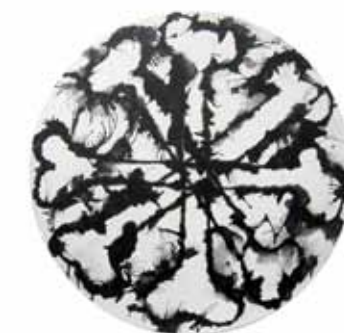
Tondo (triptique), 2008, Acrylique sur toile, toile marouflée sur bois