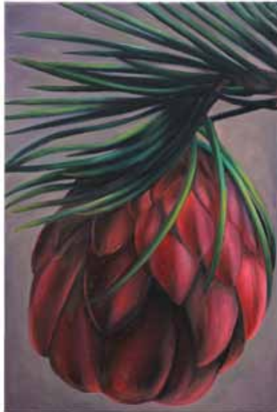
Dogtertjie, 2010, olieverf op doek