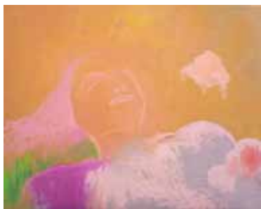
BEELD: DALILA DALLÉAS