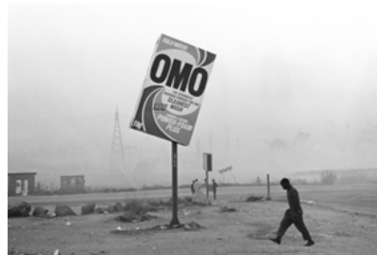
Winter in Tembisa, 1992

de multi-etnische samenleving, anderzijds de realiteit met politieke, sociale, economische en religieuze problemen.