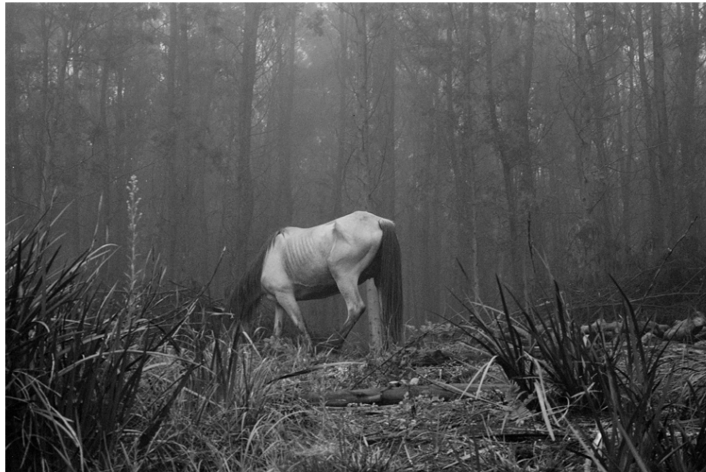
Buddhist Retreat, Near Pietermaritzburg, 2003

Maatschappijkritiek, gekoppeld aan bijna mystieke beelden leverde Mofokeng wereldfaam op. Toch is dit de eerste keer dat er een tentoonstelling van hem in Nederland te zien is. Tot 26 november te zien in de galerie van het Prins Claus Fonds in Amsterdam. www.princeclausfund.org