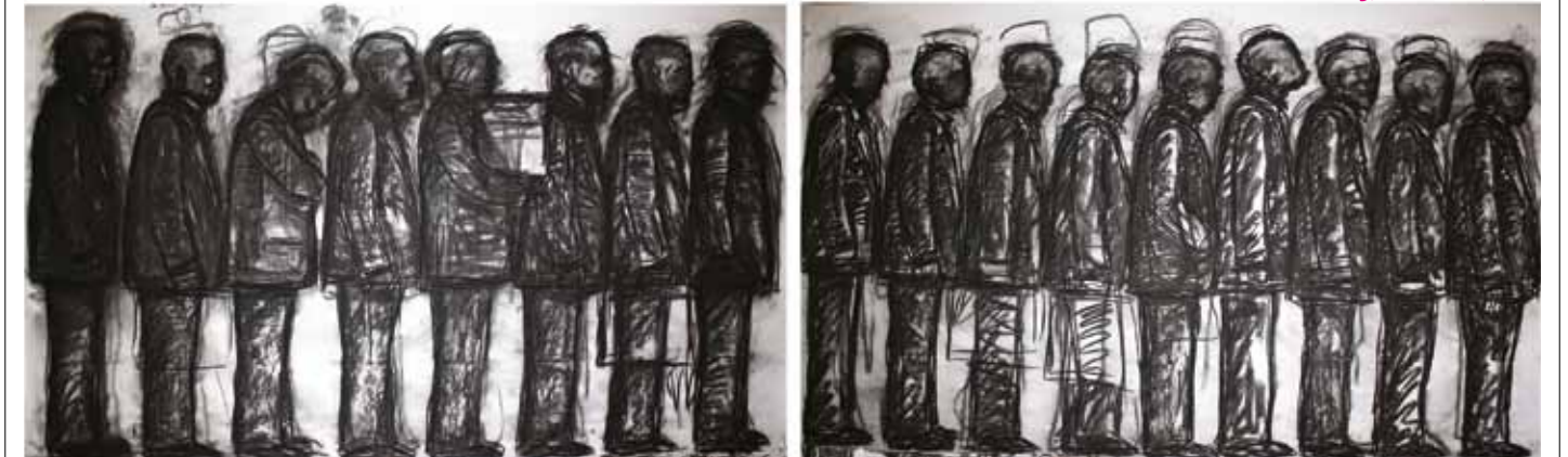
Queue#3, Recession, 2010

www.brotkunsthal.com , www.edcrossfineart.com