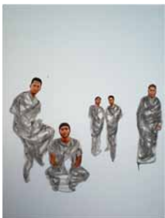
Continuum Mauritius, 2010, oil on canvas