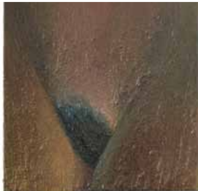
Brown, 2007, olieverf op doek

BEELDEN: INA VAN ZYL/COURTESY GALERIE ONRUST, AMSTERDAM. FOTO'S: PETER COX & ARIAN BENNING