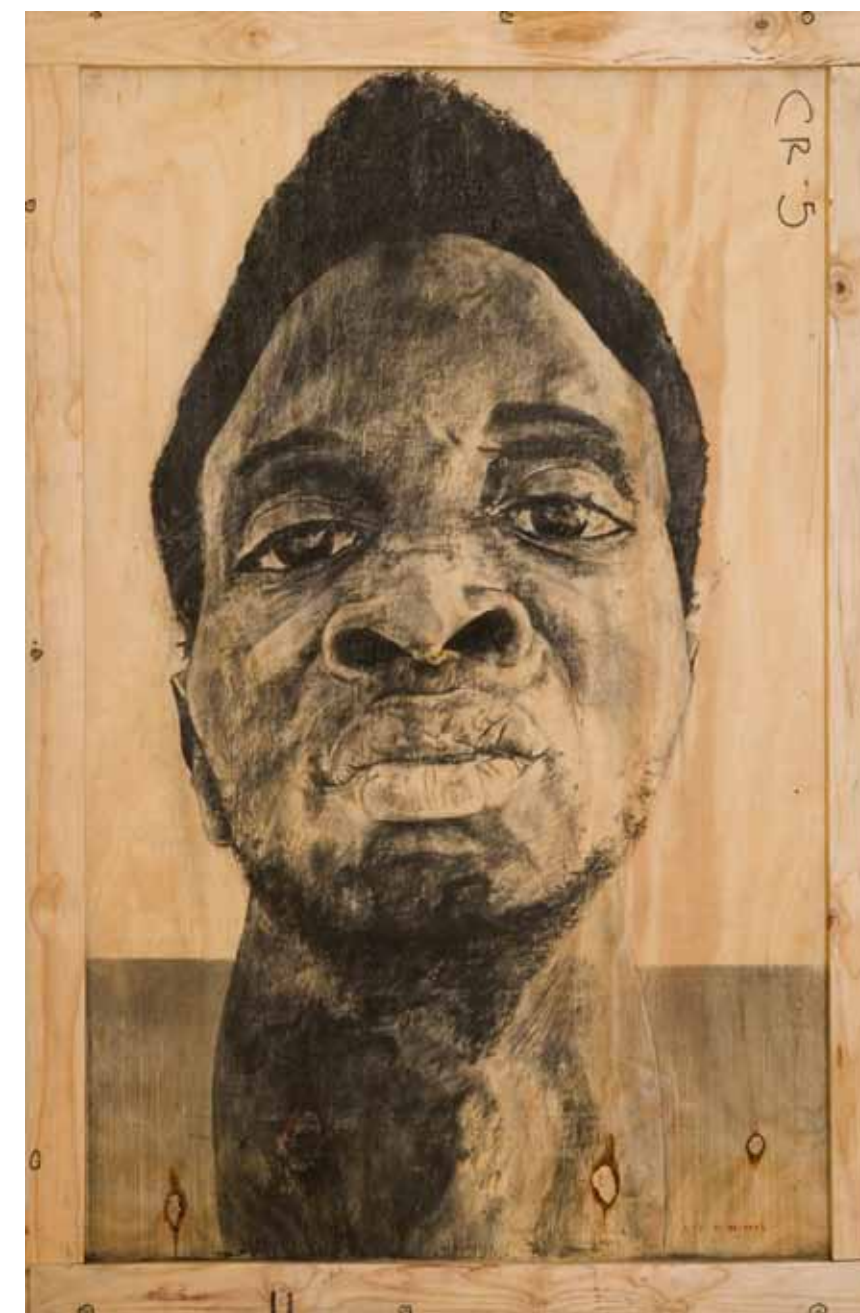
Untitled (Self-portrait), 2009, Charcoal and paint on wood, Detail